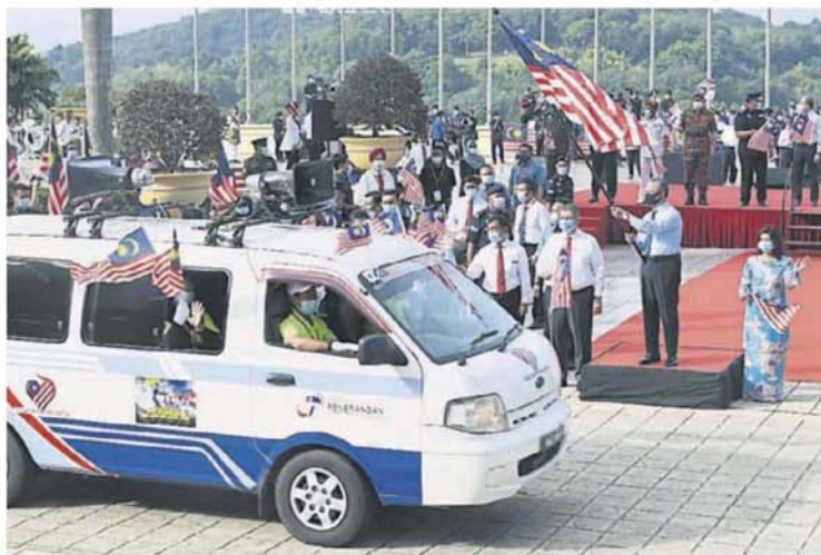
慕尤丁（右2）为“Info On Wheel Merdeka”车队主持挥旗礼。

（教育部）莫哈末拉兹博士、高级政务部长（国防部）拿督斯里依斯迈沙比里、高级政务部长（国际贸易及工业部）拿督斯里阿兹敏阿里和通讯及多媒体部长拿督赛夫丁阿都拉。