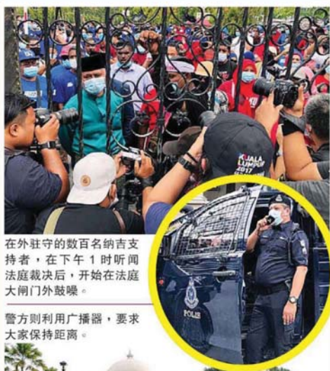
在外驻守的数百名纳吉支持者，在下午 1 时听闻法庭裁决后，开始在法庭大闸门外鼓噪。

(7) 2015 年 2 月 10 日，纳吉在吉隆坡大马伊斯兰银行，涉嫌通过即时电子转帐与结算系统 (RENTAS)，以个人户头收取 2700 万令吉，抵触同一条文。#