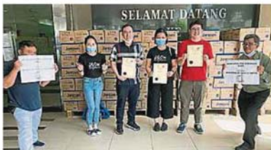
“绿化适耕庄”活动逾百人日前参与“绿