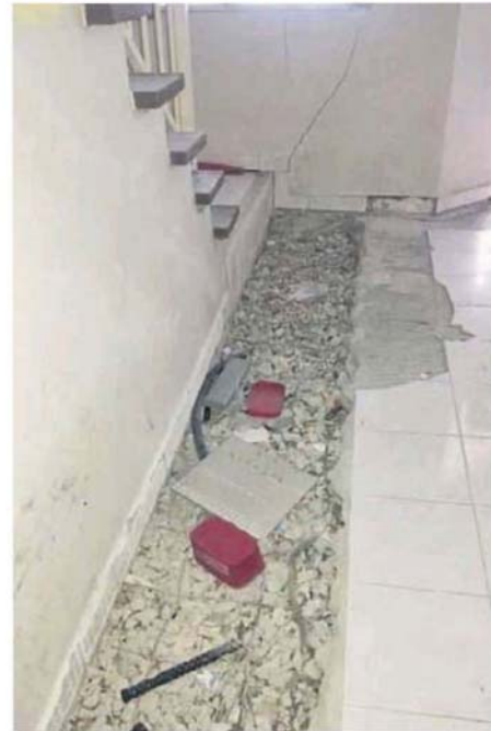
承包商在屋内挖道进行土质检测工作。