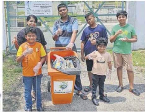
■不少家长让小朋友一起大扫除，从小就培养他们照顾