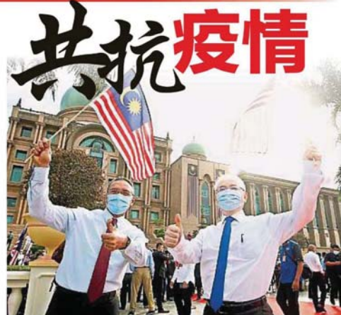
希山慕丁（左）和魏家祥挥舞辉煌条纹。

2020年國慶月及揮舞輝煌條紋運動推介禮 是尤丁（中）呼吁人民积极参与“2020年国庆月及挥舞辉煌条纹运动”的各项活动，左二为赛富丁，右二为通讯部长拿督赛富丁。 同心協力 MALAYSIA PRIHATIN 首相：人民團結一致最佳證明 共抗疫情 （八打灵再也28日讯）首相丹斯里是尤丁指出，人民不分种族、宗教和政治立场，挺身而出协助对抗新冠病毒，是大马人民团结一致的最佳证明。 他说，在艰难的时刻，人民也能同心协力，何况是在平常时期。 国庆主题“爱心大马” 他在首相署为2020年国庆月及挥舞辉煌条纹运动推介礼致词时说，今年的主题为“爱心大马”（Malaysia Prihatin），代表我国全体人民，不论是公务员还是私人界、非政府组织，每个人一起同心协力对抗新冠病毒。 他说，“PRIHATIN”就是政府的关怀人民振兴经济配套（PRIHATIN），涵盖经济、人民的福利和人民生活援助配套。 “Malaysia Prihatin”的精神不只是前线人员，也包括社会各个阶层的‘无名英雄’，他们不分种族、宗教和政治立场，挺身而出协助抗疫，这是大马人民团结一致的最佳证明。” 他说，今年8月31日的国庆日庆祝活动在吉隆坡举行，9月16日的马来西亚日全国庆典则在在砂拉越诗巫举行。 他指出，“爱心大马”的精神要在社会大众的各个层面燃起，不仅是抗疫，也要在经济复苏、追求更美好生活时贯彻这种精神。 “如此一来，我国才能更加巩固人民的团结、和谐与幸福，我们一起努力。”