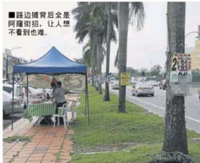
■路边摊背后会是阿隆街招，让人想不到也难。

他明白，在疫情期间，很多人面对资金周转和钱不够用的问题，但是无论再怎么如何缺钱，也千万不要碰大耳窿阿隆街招。