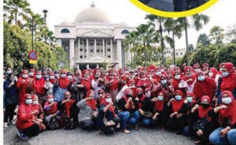
穿上红装的女支持者聚集在庭外为纳吉加油打气。