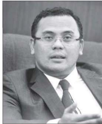
阿米鲁丁 ▽ 慕尤丁近期或解散国会。