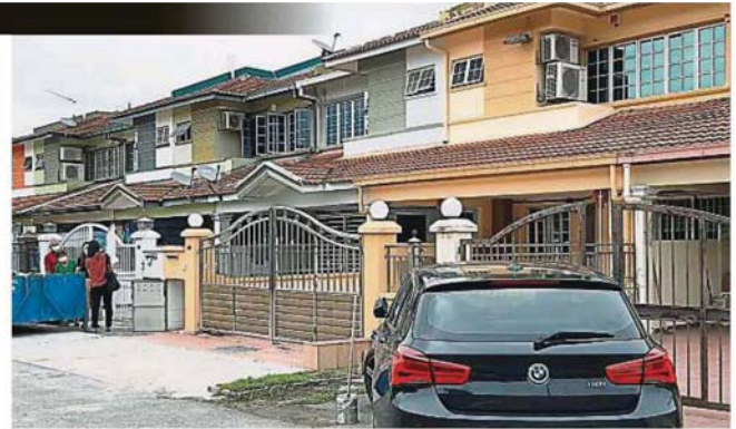
陳明金花園數個雙層單位，在早前受到排污系統泵房工程影響，造成不同程度損壞。