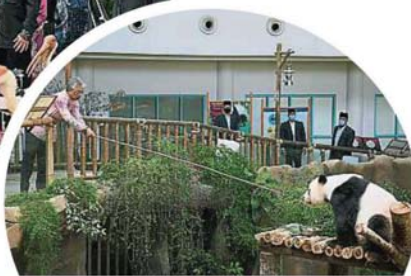
— 國家元首蘇丹阿都拉陛下（左）到訪國家動物園，除了觀賞動物，也走訪動物園的展覽區，還給熊貓喂食。