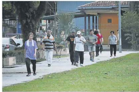
管控令放宽后，公园晨运人数有增加，但仍较管控令前少。

雪州政府日前修正地方政府法令，首开先例严禁民众在公园内抽烟及喝酒，包括电子烟，并通过加强 2005 年地方政府公园法令，赋予权利让执法人员对违例者开出罚单，违例者将被罚款最高 1000 令吉。