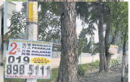
■阿隆街招无所不在，连学校周围也挂满。