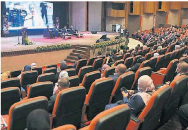
■睽违3个月后，雪州政府恢复公务员常月集会，但为配合防疫新常态，出席人数较往年少。