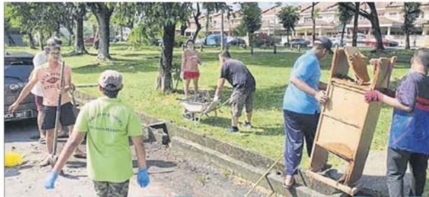
■各族居民不分你我，为打造优质居住环