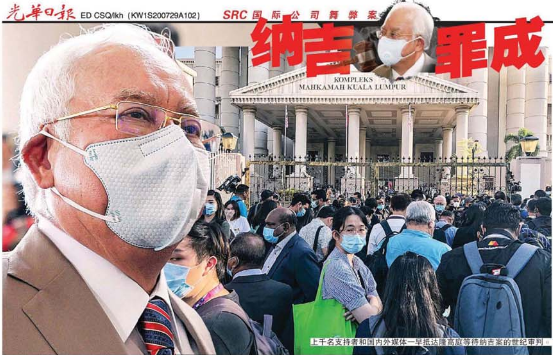
上千名支持者和国内外媒体一早抵达隆高庭等待纳吉案的世纪审判。

Provided for client's internal research purposes only. May not be further copied, distributed, sold or published in any form without the prior consent of the copyright owner.