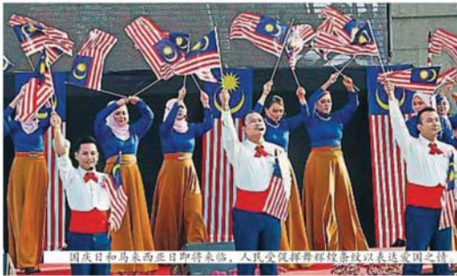
国庆日和马来西亚日即将来临，人民爱国情怀洋溢以致表达爱国之情。