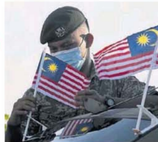
推动爱国精神，一起来张挂「辉煌条文」，响应