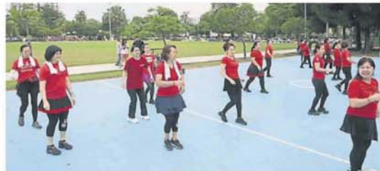
大家保持一米距离，学习舞蹈。

“各地方政府执法人员目前都有到公园巡逻，目前是先劝告，希望民众自我醒觉，毕竟执法人员难在所有公园巡逻执法，所以民众应自觉在公共环境该和不该做的事。”